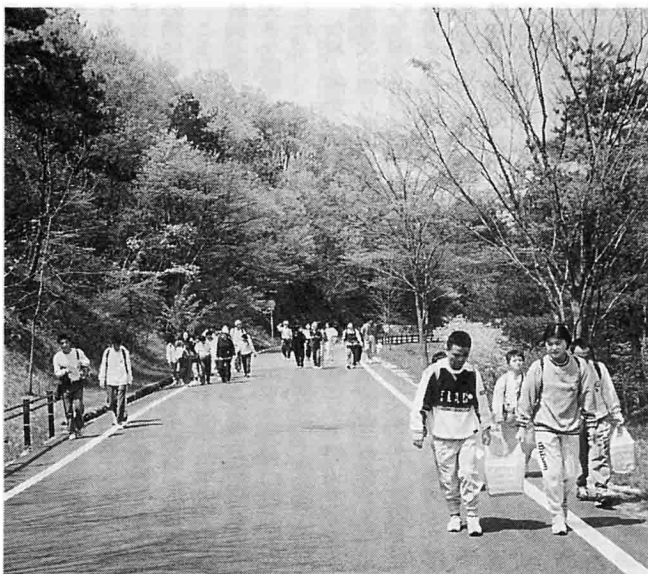
中央道を軽快に歩く参加者(往路)