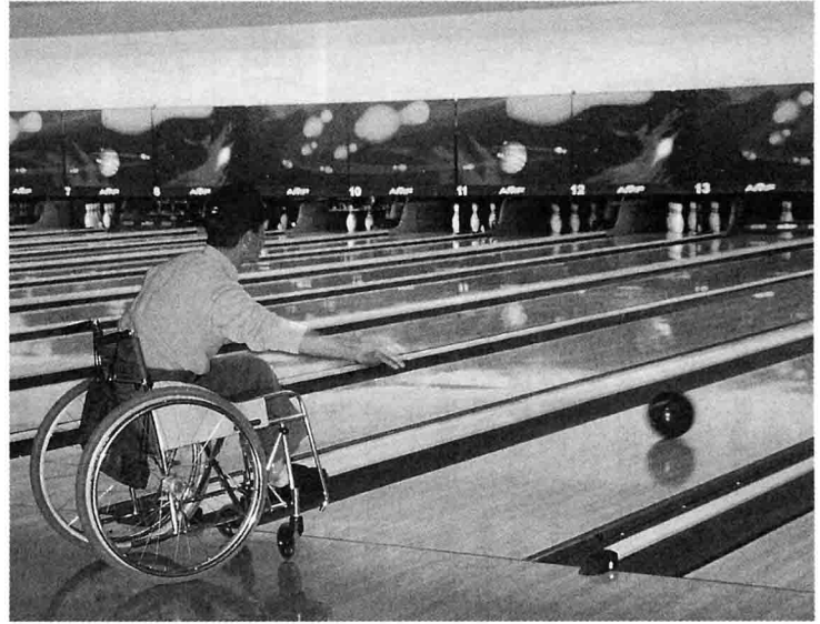
車イスでの参加者の見事な投球シーン(男子Dクラス)

1月30日(土)、大津ボウルにおいて第1回滋賀県障害者ボウリング大会を開催致しました。当協会では昨年度教室としてボウリング競技に取り組みましたが、教室とはいっても種目の特性上競技会形式を取らざるを得ず、実態としては大会といってもおかしくない内容の教室となりました。そこで教室から大会に格上げし、協会自主事業として3つ目の県大会としてスタートすることになりました。