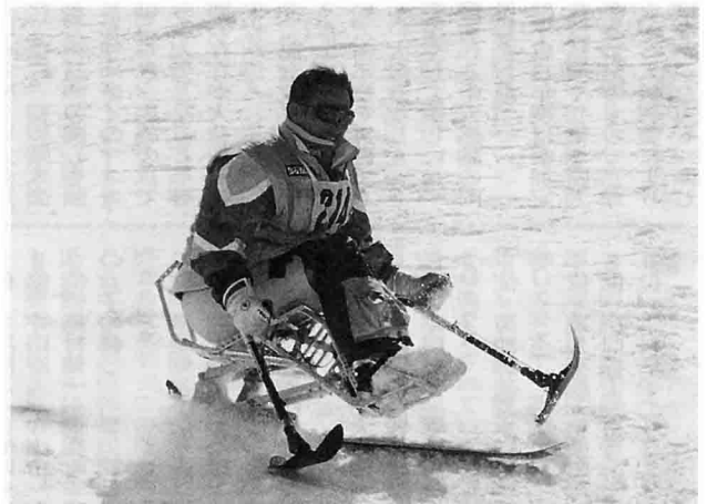
チェアスキーで滑る受講者

2月16日(火)、びわ湖バレイスキー場(志智町)において、第11回スキー教室を開催致しました。 この教室は毎回天候に恵まれず、吹雪に悩まされてきました。が、今回は予想を覆し、終日に渡り曇一つない快晴。白銀に反射する陽光の祝福を受け、参加者たちは最高の一日を山上で過ごす事ができました。 今回の教室も例年どおり平日の開催となりましたが、学校スキーとも重なり滑走者が多く、中でも教室に適当な緩斜面が混雑し、障害によっては動きが制限される事も多い受講者にとつては危険な場面も幾度かありました。ご指導頂いた県スキー連盟の方々の的確な判断により大過なく教室を進める事がで