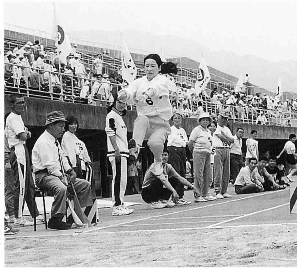
スタンドの声援をバックに…(女子1部走幅跳での一コマ)