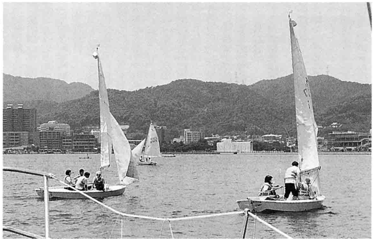
微風の中、操艇を教わる参加者たち