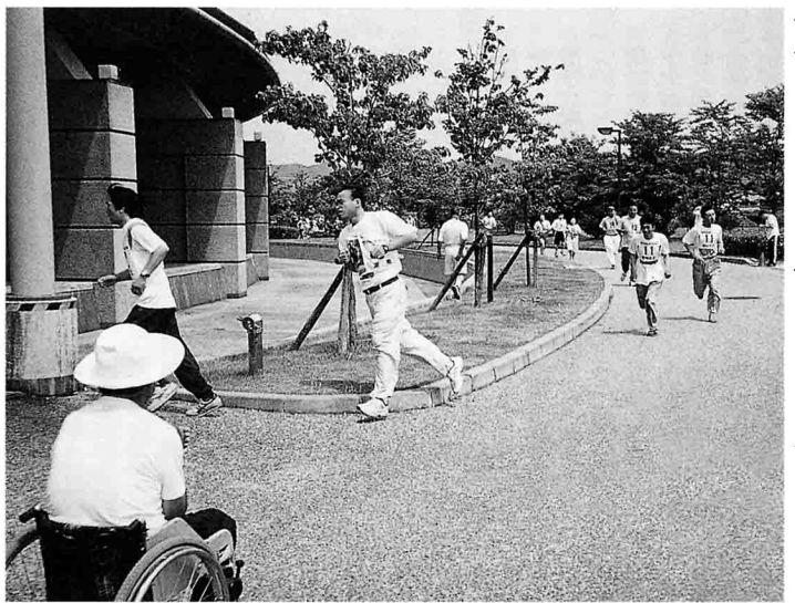
ドーム屋外を走る参加者(800m競走での一コマ)

7月11日(日)、県立長浜ドームに於いて、第18回滋賀県スペシャルスポーツカーニバルを開催致しました。 夏の長浜ドームの行事としてすっかり定着したこのカーニバルには、今年も朽木村を除く県内各市町村からあわせて千人もの参加者があり、賑やかな大会となりました。 また、昨年は知事選挙の絡みでカーニバルの時間短縮を行ない、花形競技の一つである八〇〇・一五〇〇m競走を八〇〇m競走のみに統合して行なった為、参加者の中には何か物足りない