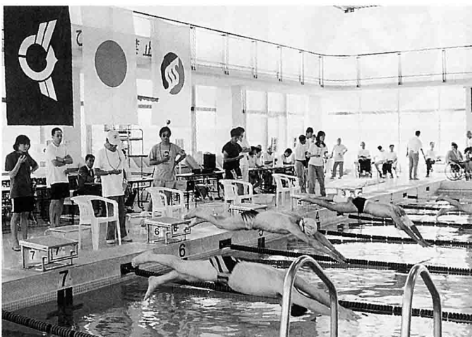
50m自由形の飛び込みスタートの瞬間

6月20日(日)、県立彦根総合運動場スイミングセンターに於いて、第37回滋賀県障害者スポーツ大会(水泳競技)を開催致しました。