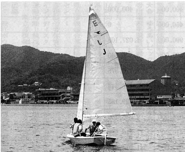
写真は昨年の一コマ