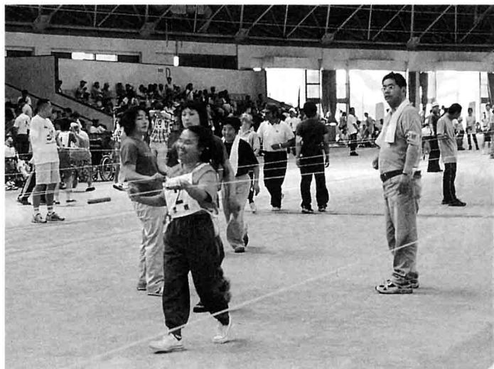
ガイドラインを用いての60m徒走