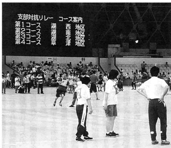
支部対抗リレーでの一コマ

7月7日(日)、県立長浜ドームにて、第21回滋賀県スペシャルスポーツカーニバルを開催しました。