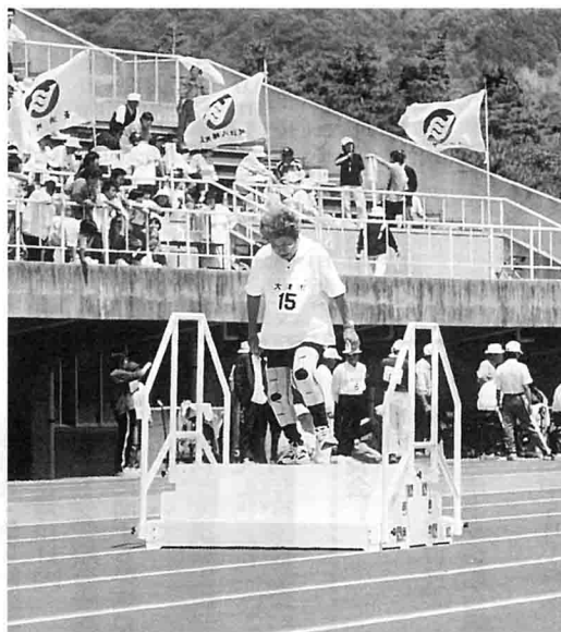
障害急歩の階段の障害を上げる選手