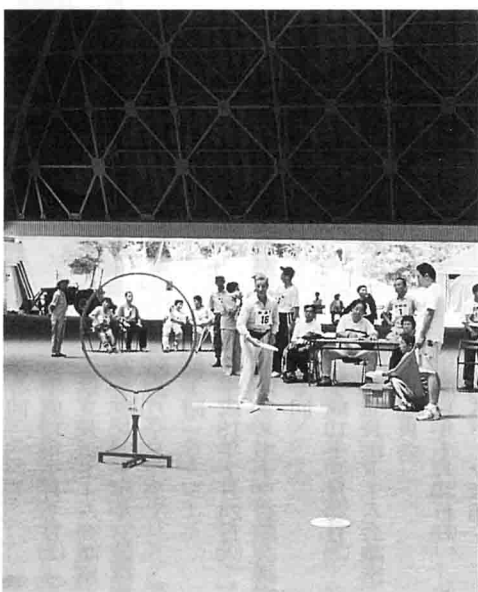
アキュラシー競技ディスクリート5のコマ

そして、エキジビジョンとして大会のフィナーレを飾る、リレー競技で大きな盛り上がりを見せる中、今年の大会も幕を下ろしました。