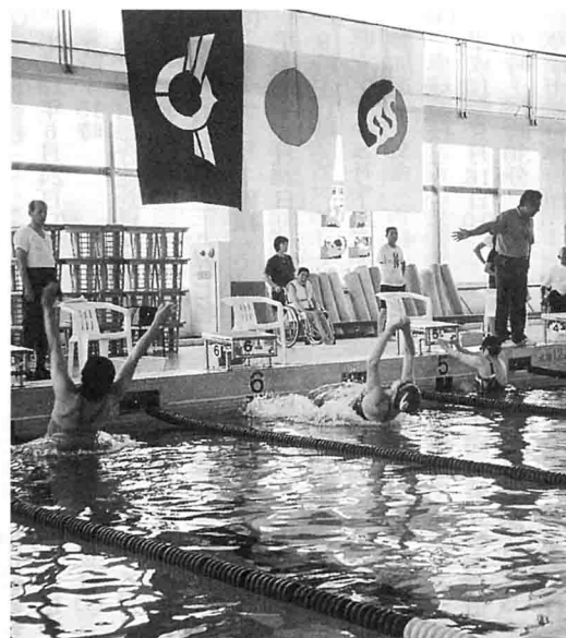
背泳ぎのスタートの瞬間

今大会には前回を大きく上回る220名の参加があり、この競技の人気が急速に高まっていることを物語っていました。