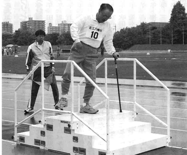
障害急歩競技での一コマ