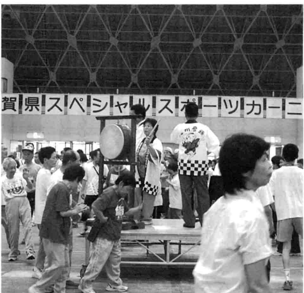
総おどり「江州音頭」の一コマ

7月10日(日)、県立長浜ドームにおいて、第24回滋賀県スペシャルスポーツカーニバルを開催しました。今回から市町村の合併にともない、県大会と同様の16地区制に生まれ変わったカーニバルですが、残念ながら湖南市から参加者がなかったことをはじめ、施設単位の参加減少の影響等もあり、カーニバルとしてはもともと少ない815名の参加にとどまりました。このように参加者数は少なかったものの、在宅の参加者を中心として、いつも通り楽しく賑やかなカーニバルとなり、夏の1日をドームで楽しく過ごすことができました。