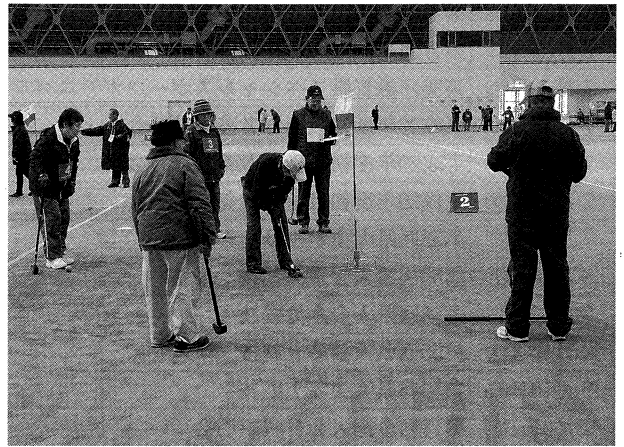
会員交流グラウンド・ゴルフ選手権大会 (長浜バイオ大学ドーム 11月26日)