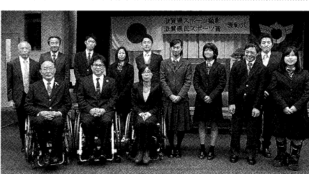
スポーツ顕彰・県民スポーツ賞表彰式(2月17日)