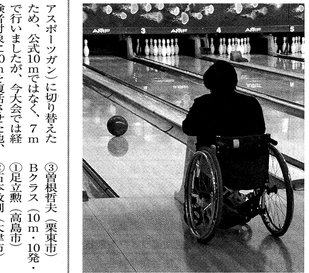
会員交流ボウリング大会 (ラウンドワン浜大津 3月4日)